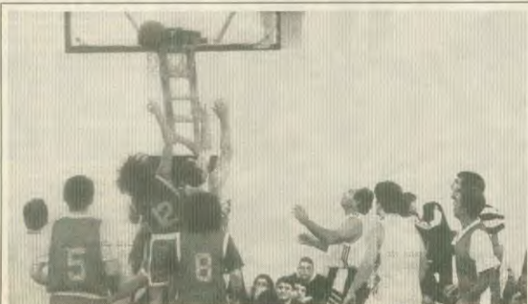
Τα παιδιά του «18 Ανω» σε αγώνα μάχη με την ομάδα των Ολυμπιονικών

Ο ψευδευπίγραφος δρόμος της αποπαινοποίησης, του διαχωρισμού σε «σκληρά» και «μαλάκα» και της διάδοσης των υποκατάστατων