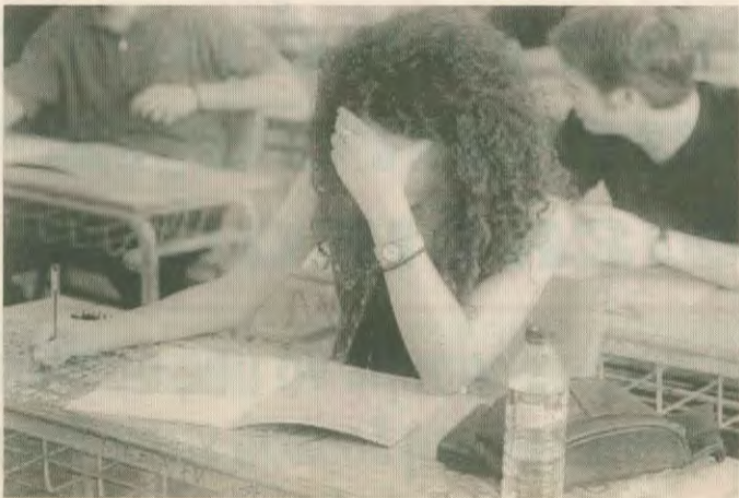
Τα αποτελέσματα των πρόσφατων εξετάσεων της Β' και Γ' Λυκείου απέδειξαν τον αντιδραστικό χαρακτήρα της εκπαιδευτικής «μεταρρύθμισης»

Η εκπαιδευτική πολιτική της κυβέρνησης έρχεται να αποσπαστεί τη σύγχρονη κοινωνική ανάγκη για περισσότερη και πολυπλευρή μορφή και