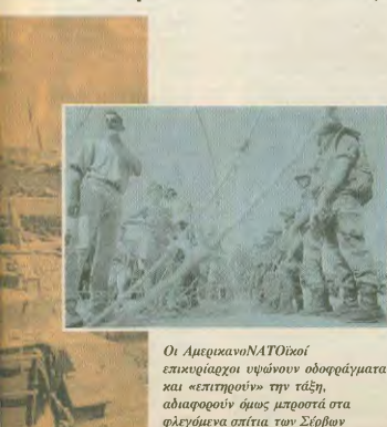
Οι ΑμερικανοΝΑΤΟϊκοί επικεφαλής υφάνουν οδηγώματα και «επιτηρούν» την πύλη, διαλαρώνον όμως μπροστά στα φλεγόμενα σπίτια των Σέρβων

δωμών την επίθεσή υπερπληρωτική Ευρώπη των πολυεθνικών, του πόλεμου, της φτώχειας και της κοινωνικής αδικίας.